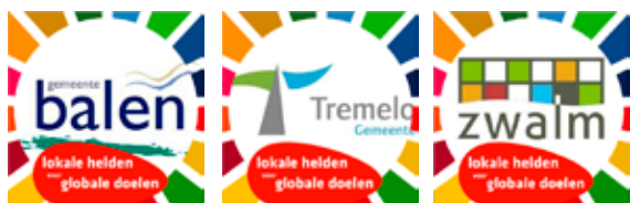
Facebookframe conçu par VVSG en 2020.

Nous fournissons par ailleurs des matériaux de communication prêts à l'emploi. Les communes peuvent utiliser ceux-ci dans le cadre de leur communication sur leur participation à la campagne et leurs héros durables. Il s'agit notamment de bannières numériques avec l'image de la campagne, d'un