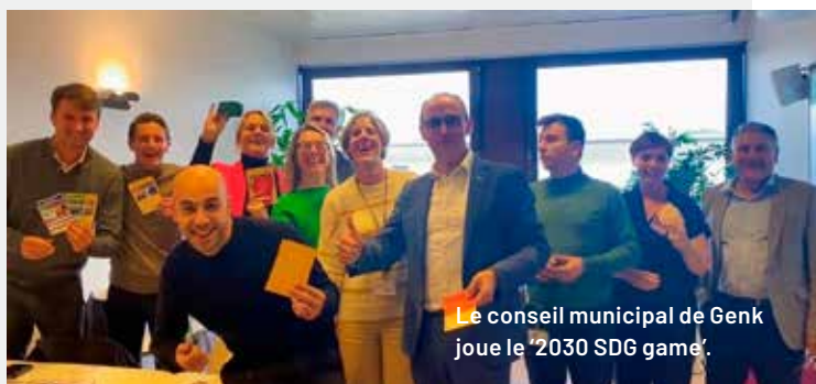
Le conseil municipal de Genk joue le '2030 SDGs game'.