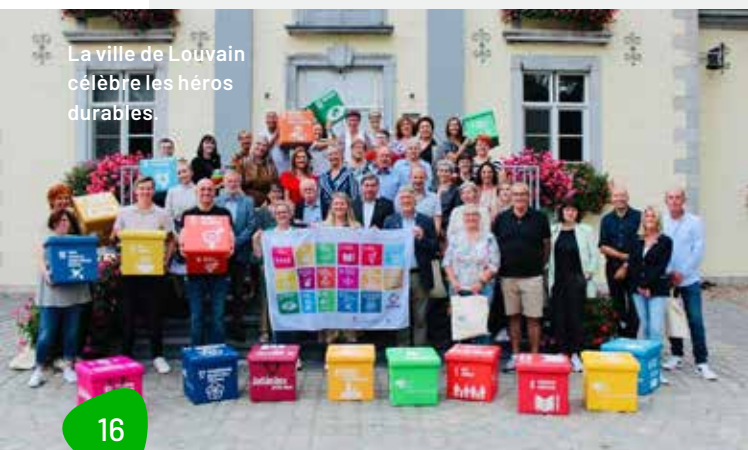
La ville de Louvain célèbre les héros durables

La ville de Genk (>60 000 habitants) profite aussi de la Semaine de la commune durable pour informer intensivement ses habitants et le personnel communal sur les ODD. En 2022, les organisateurs se sont par exemple rendus au marché de légumes local, organisé chaque semaine, pour expliquer aux visiteurs, grâce à un jeu de bingo ODD, comment devenir des héros durables dans leur vie quotidienne. Chaque membre du personnel communal (1 300 personnes !) a également reçu une carte de bingo ODD. Les services pouvaient soumettre une carte de bingo commune pour tenter de remporter un petit-déjeuner équilibré. Le collège des échevins et l'équipe de management ont encore approfondi l'Agenda 2030 et joué au 2030 SDGs Game (développé par l'asbl japonaise Imacocollabo). Le bourgmestre a attesté que le jeu a ouvert de nombreuses nouvelles perspectives, notamment en ce qui concerne la conclusion de partenariats permettant de réaliser les ODD au niveau local.