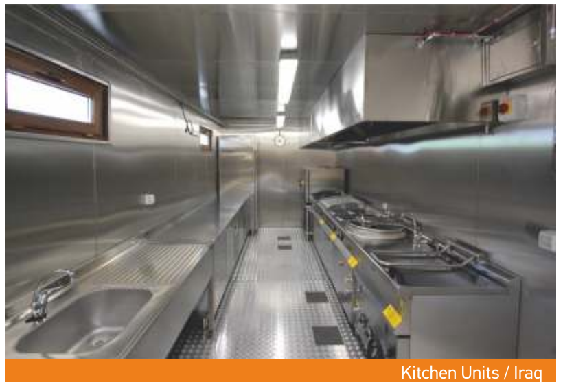
Kitchen Units / Iraq