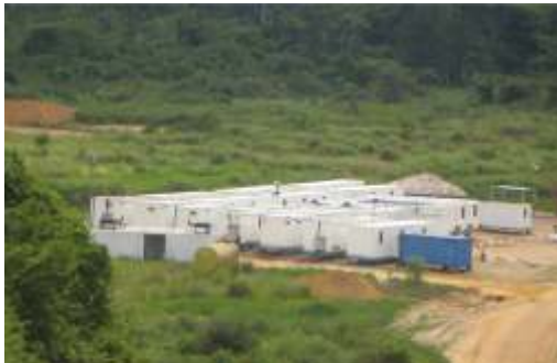
Turnkey Camp Project with Skids / Congo