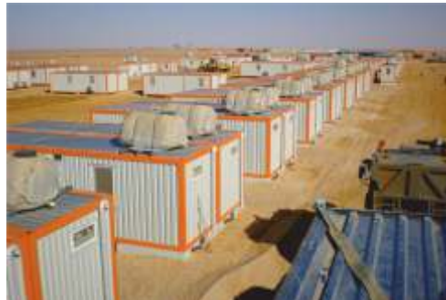
Turnkey Camp with Water Tanks / Libya