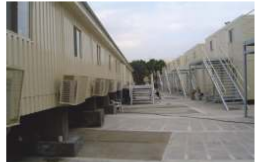
Greenzone Military Camp / Iraq