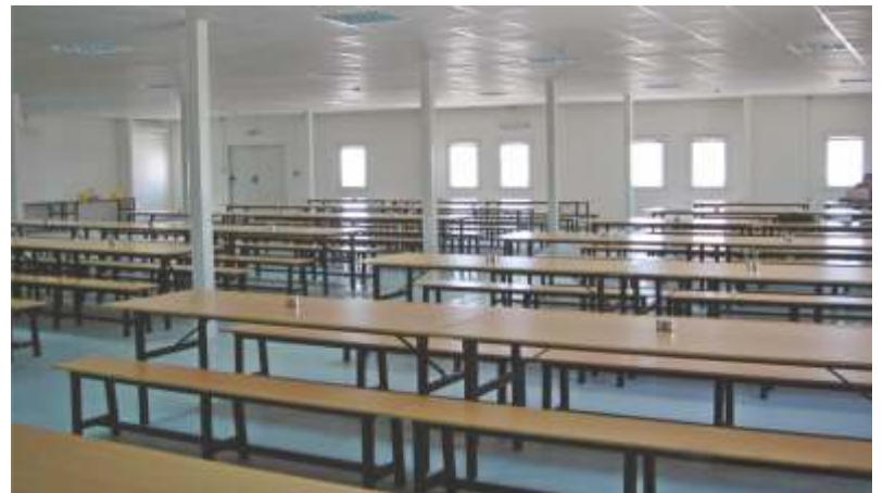
QATALUM CONSTRUCTION VILLAGE FOR 10.000 MAN MESAIEED INDUSTRIAL CITY - DOHA - QATAR 10.000 KİŞİLİK KATALUM İNŞAAT KASABASI MESAİED SANAYİ ŞEHİRİ - DOHA - KATAR