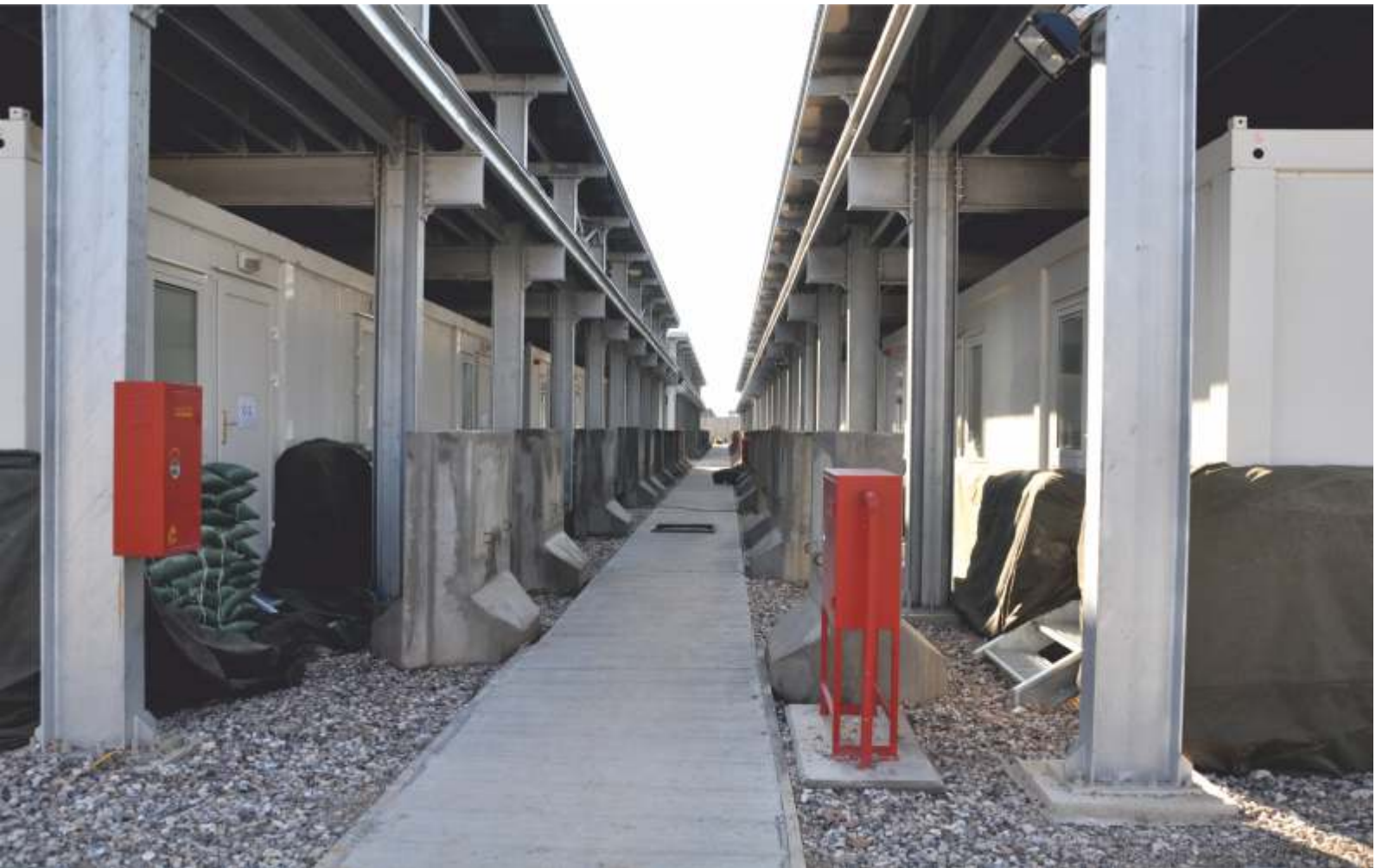
LIFE SUPPORT CAMP / ZUBAIR OIL FIELD - BASRAH - IRAQ YAŞAM DESTEK KAMPI / ZÜBEYİR PETROL SAHASI - BASRA - IRAK