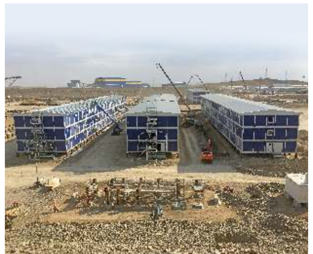
Aktogay Expansion Project - 2620 Man Accommodation Camp Construction / Kazakhstan

MODULAR / CONTAINERIZED UNITS / TRAILERS MODÜLER / KONTEYNER ÜNİTELERİ / RÖMORKLU KONTEYNERLER