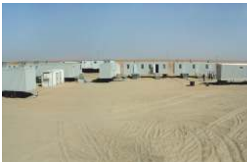
Turnkey Camp / Libya