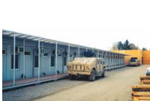
Military Camp/ Afghanistan