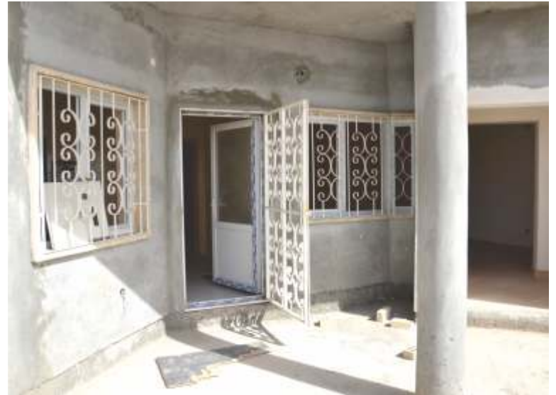
1.416 VILLA HOUSING COMPLEX AND SOCIAL FACILITIES / BASRAH - IRAQ 1.416 VİLLA TOPLU KONUT KOMPLEKSİ VE SOSYAL TESİSLERİ / BASRA - IRAK