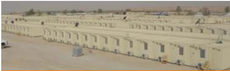
B1 Site Military Camp / Iraq