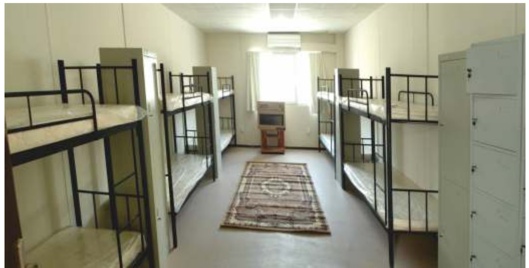
16.000 MAN RESIDENTIAL CITY / AL MAFRAQ, ABU DHABI - UAE 16.000 KİŞİLİK YERLEŞİM ŞEHİRİ / AL MAFRAK, ABU DABİ - BAE