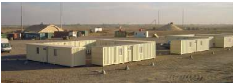
Accommodations modified from shipping containers