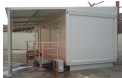
Simandou Worker Camp - 23 Dif. Locations / Guinea