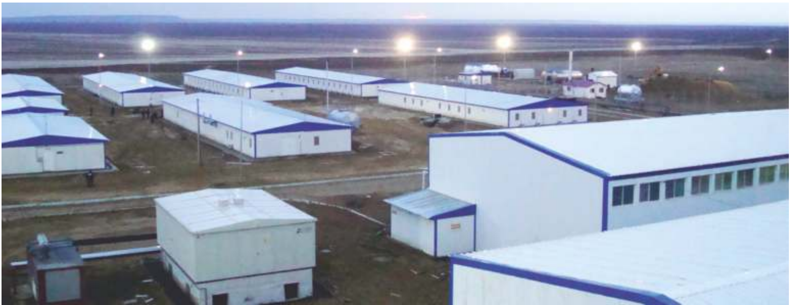
SHAGYRLY SHOMYSHTY GAS DRILLING AND PROCESSING FACILITY / BEYNAU - KAZAKHSTAN SHAGYRLY SHOMYSHTY DOĞALGAZ SONDAJ VE İŞLEME TESİSİ / BEYNAU - KAZAKİSTAN