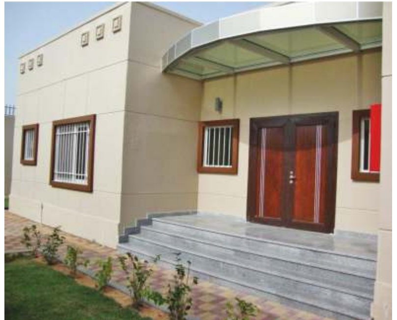
MINISTRY OF INTERIOR STRATEGIC BUILDINGS / ABU DHABI – UAE İÇ İŞLERİ BAKANLIĞI STRATEJİK BİNALARI / ABU DABİ - BAE