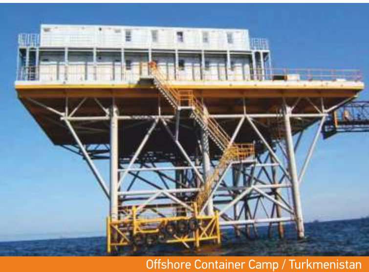
Offshore Container Camp / Turkmenistan