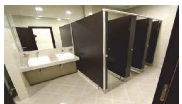
CITY HOTEL DUQM WITH 120 BED CAPACITY / AL DUQM – OMAN DUQM ŞEHİR OTELİ (120 ODA KAPASİTELİ) / AL DUQM – UMMAN