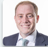
Rhys ab Owen AS Aelod Annibynnol Plaid Cymru