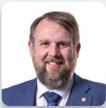
Peredur Owen Griffiths AS Plaid Cymru