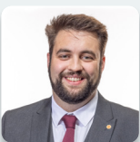
Luke Fletcher AS Plaid Cymru

Roedd yr Aelod a ganlyn hefyd yn aelod o'r Pwyllgor yn ystod yr ymchwiliad hwn: