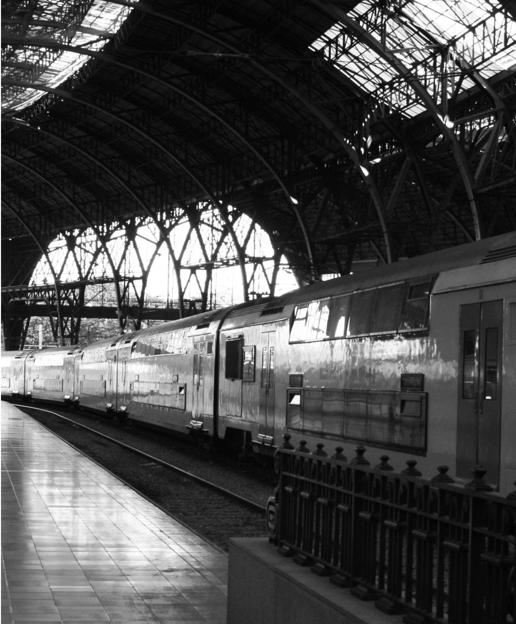
FOTO: A l'estació de França arribaven les persones procedents de la resta d'Espanya.