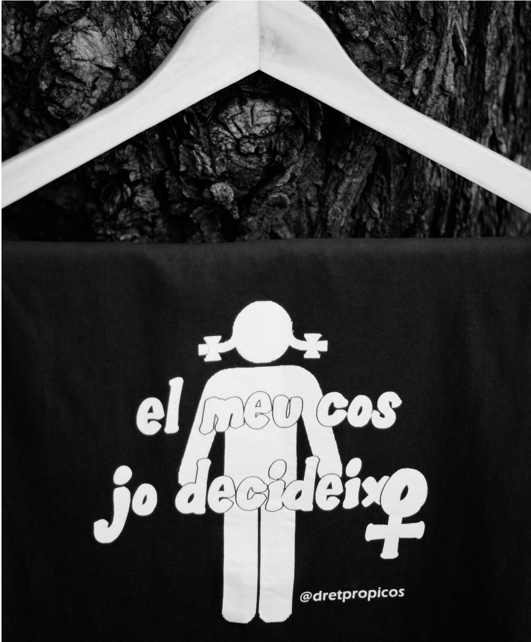
FOTO: L'Engràcia sempre ha mantingut un gran compromís amb la lluita feminista.